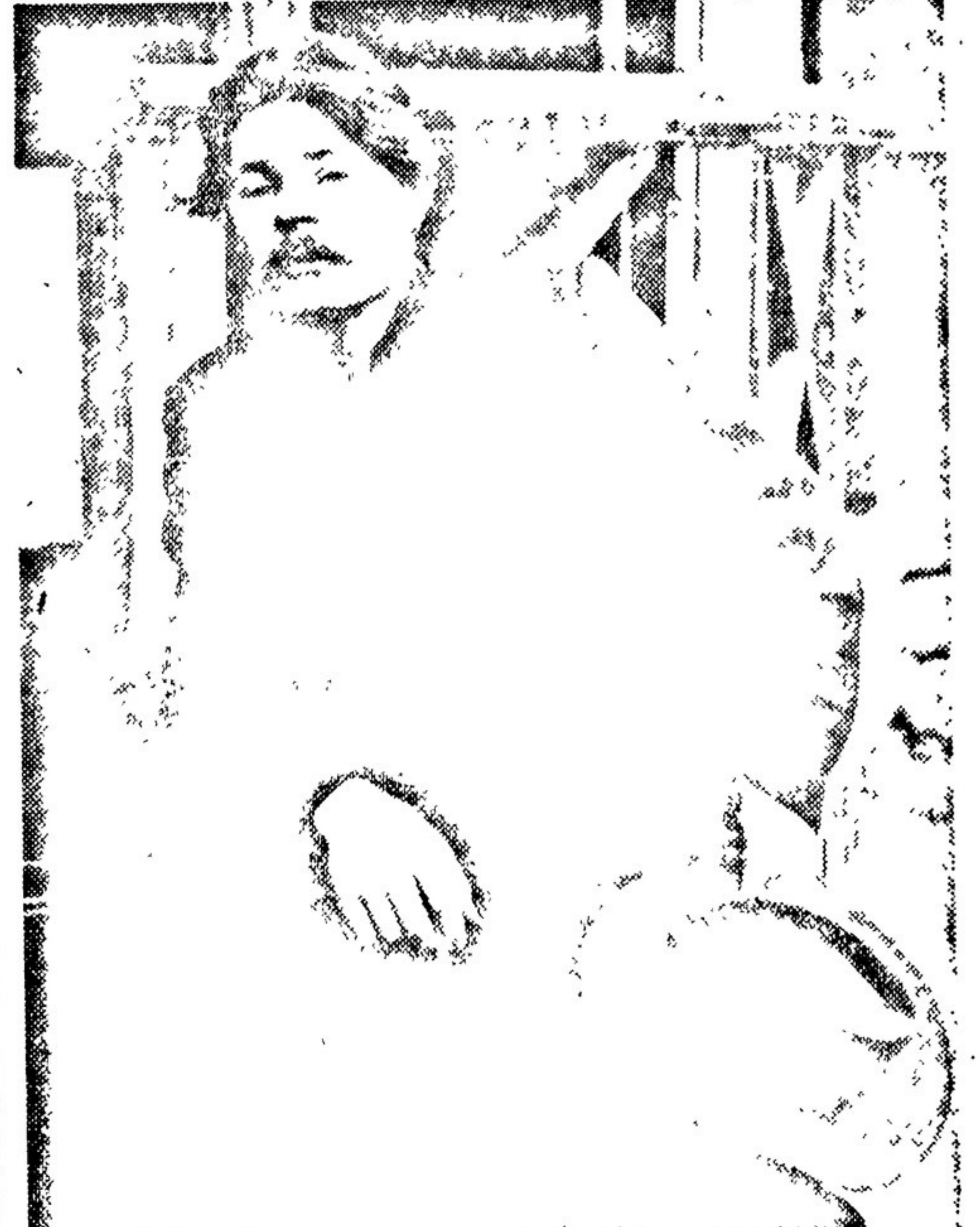
А. М. Горький в Куоккала на террасе дома И. Е. Репина (Финляндия) 1905 г.