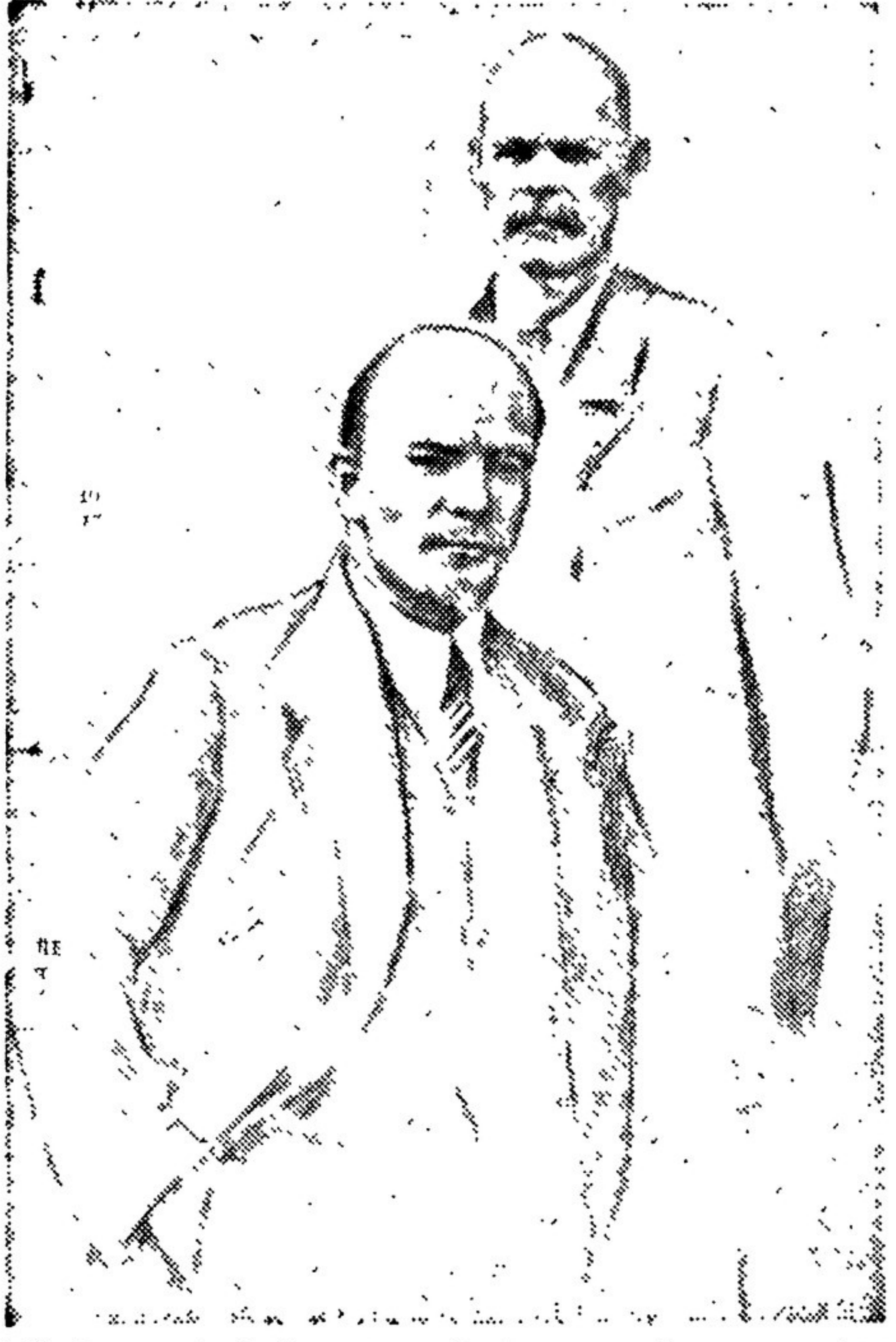
И. Ленин и А. М. Горький на II Конгрессе Коминтерна (лето 1920 г.). Рис. Г. Верейского

Кий составляли мне компанию, но теперь никого не осталось со мной, кроме Ульяна, который много моложе меня, но который все же относится к XIX веку. Но правда сказать, пора уже исчезнуть всем нам — революция XIX века. СССР ждет слышимое будущее, чтобы бесконечно пошлому.