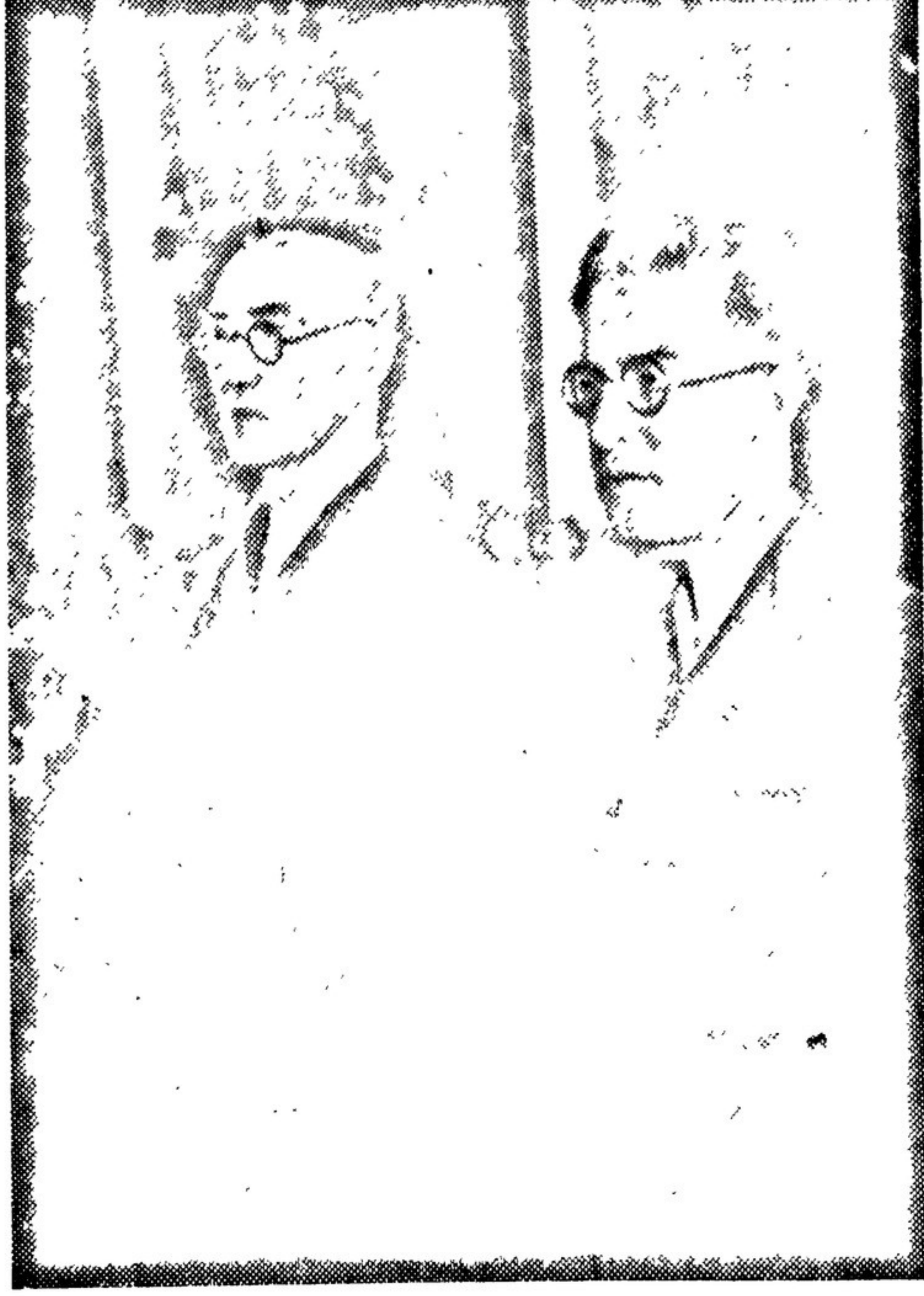
Андрэ Жид и Мих. Кольцов в почетном карауле у гроба А. М. Горького