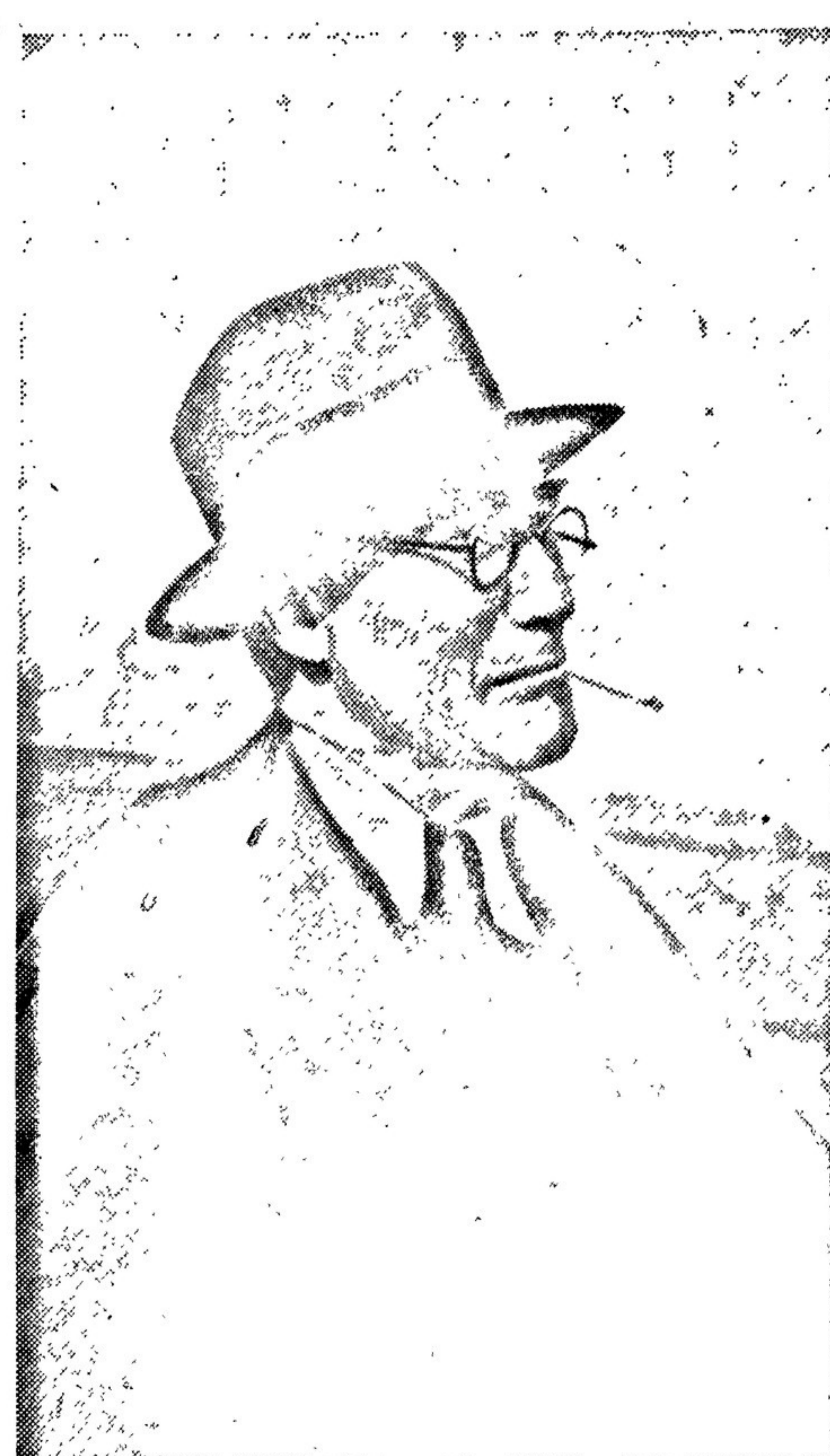
17 июня, в 5 час. 30 мин. дня в Москву прилетел один из крупнейших писателей современного Запада, друг Советского Союза, Андрей Жид. В ближайшем номере «Литературной газеты» мы посвятим специальную страничку творчеству Андрея Жиды. На фото: Андрей Жид в Москве.